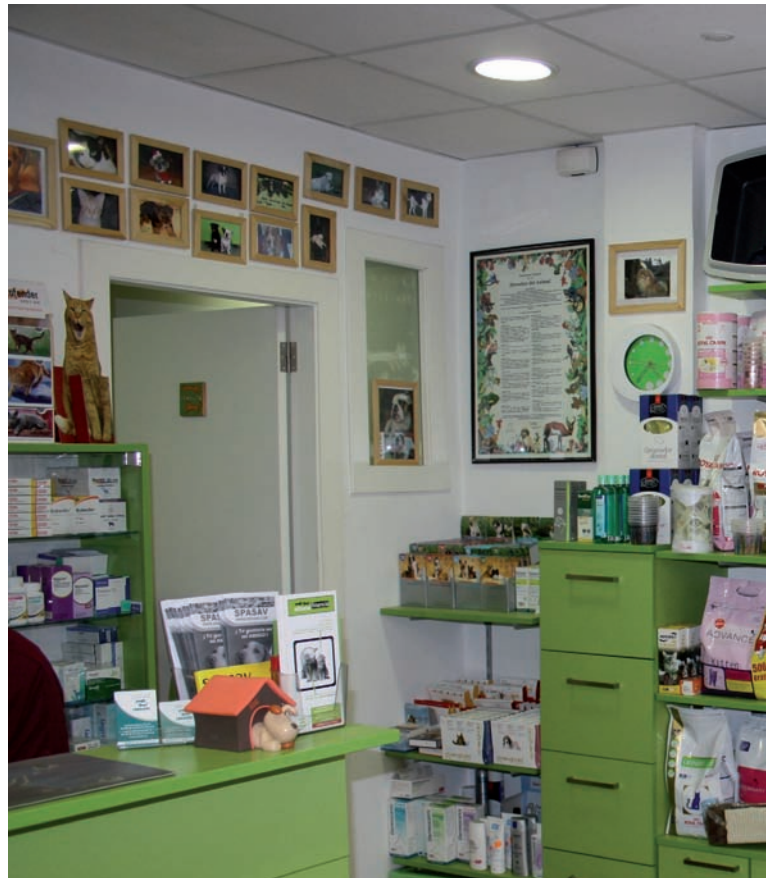
La colocación de los antiparasitarios en las zonas calientes del local ayudará a recordar continuamente la necesidad de estos productos.

En mi experiencia trabajando con centros veterinarios españoles, he constatado que los porcentajes de no cumplimiento periódico de las pautas de desparasitación varían en función de parásitos internos y externos, pero suelen rondar un 40% y un 30% respectivamente. Estos porcentajes se tienen que subir hasta un 90% o un 100% por beneficio de todos, fundamentalmente de las