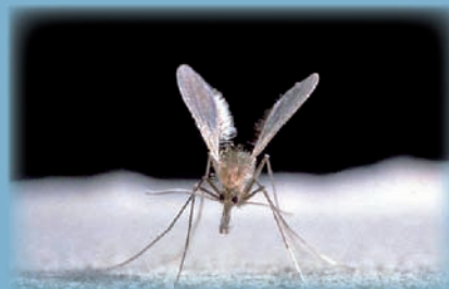
Vista frontal de un flebotomo. Imagen publicada en la revista Canis et Felis , nº 89, 2007, referenciada en la bibliografía y propiedad de los autores de la monografía.